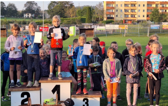
Leistungsvergleich mit Nachwuchssportler unserer Region

Des Weiteren fanden wieder ein Sponsorenlauf „Tartan statt Asche“ zur Sanierung des Sportplatzes sowie die Tombola auf dem Weihnachtsmarkt statt. Außerdem hat sich unsere Sparte beim Waldsubotnik im Frühjahr engagiert.