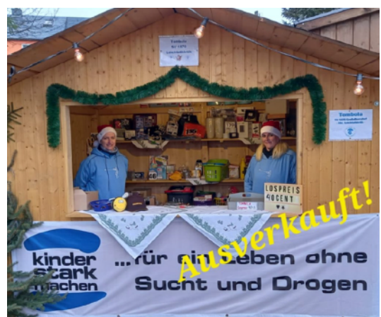
Tombola auf dem Weihnachtsmarkt