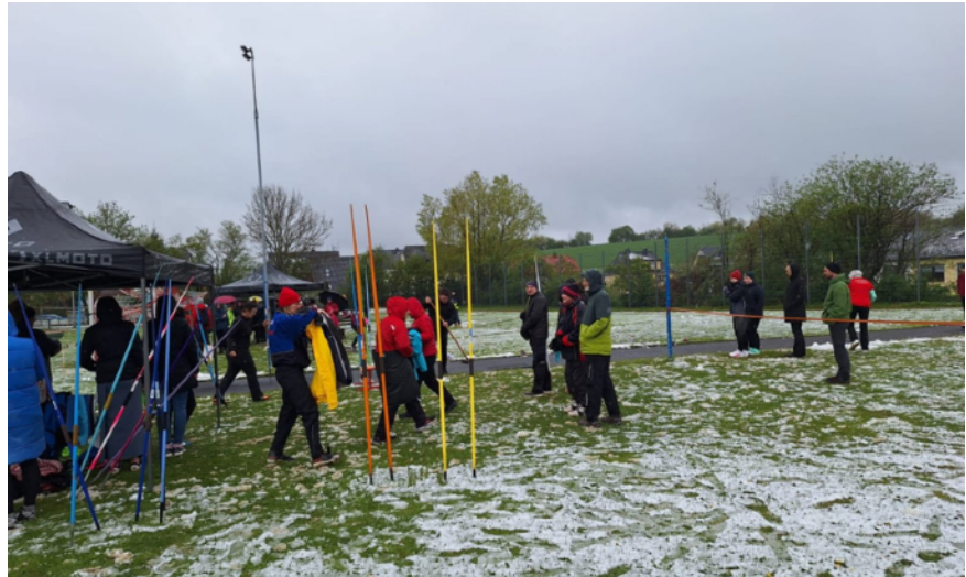
Nasskaltes Wetter beim Werferpokal im April

Des Weiteren fanden wieder ein Sponsorenlauf „Tartan statt Asche“ zur Sanierung des Sportplatzes sowie die Tombola auf dem Weihnachtsmarkt statt. Außerdem hat sich unsere Sparte beim Waldsubotnik im Frühjahr engagiert.